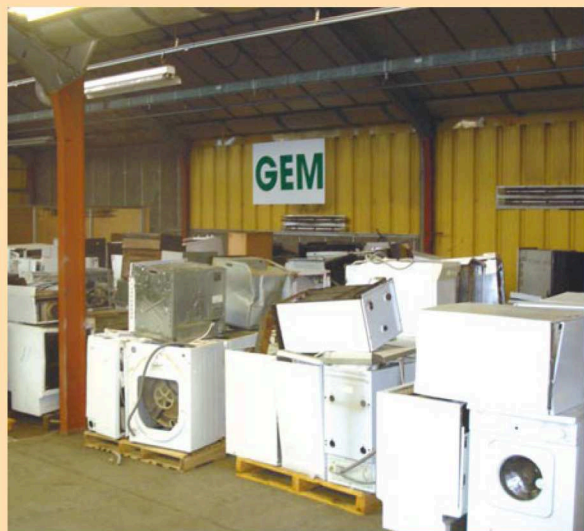
En attente de démantèlement