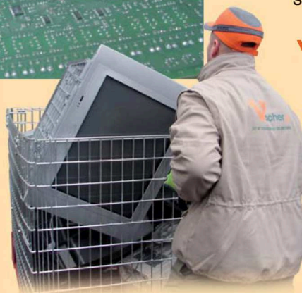
Levée de DEEE en racks